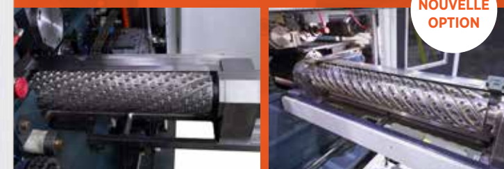
Têtes de coupe à spirales continues