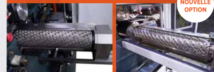
Têtes de coupe à spirales continues

Améliore l'uniformité du séchage lorsqu'elle est utilisée avant